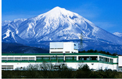
シグマ会津工場（福島県耶麻郡磐梯町）のご案内

注意：ツアー成立の最低参加人数は、13名以上となります。最低人数が満たせない場合は、中止の場合もございますので、ご理解願います。